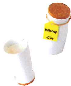
牛乳瓶そっくりな「milk cup」