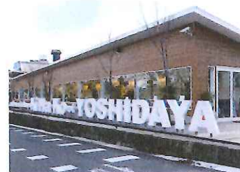
吉田屋がいとなむKiHaKo。“嬉しいがいっぱい詰まった箱”が名前の由来