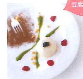
「とけないジェラード風とうふのセミフレッド」580円

「宿泊しない人でももっと気軽に立ち寄れて、嬉野の良さを知ってもらえる場所を」と、〈旅館吉田屋〉が2013年7月にオープンしたカフェ&ショップ。嬉野や佐賀そして日本の良さを発信するべく、その地にちなみ、デザインの洗練された雑貨やお菓子を販売。「ちょっとイイモノ」に出会える。地元産食材を使った料理もおすすめ。