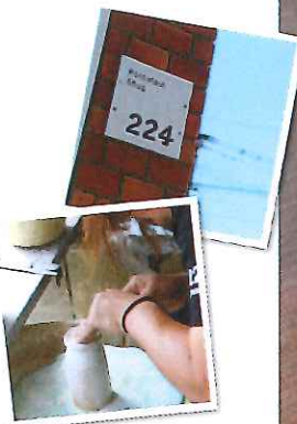
1つ1つの商品を心を込めて削りだす