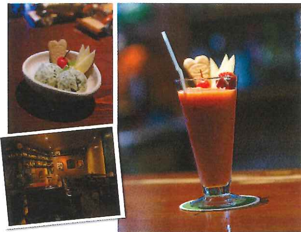
嬉野茶をふんだんに使ったアイスは、とっても風味豊か！可愛い盛り付けにも注目