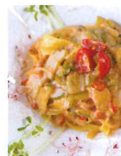
冬季限定の「帆立とズッキーニのタリアテッレ」1,000円