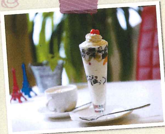
「コーヒージェリーソフト」550円 「ウイナーコーヒーカーメル」450円

佐賀県嬉野市嬉野町大字下宿乙2179-1 ☎0954-43-1332 11:30~15:30/18:00~20:30 不定休 20席 P6台