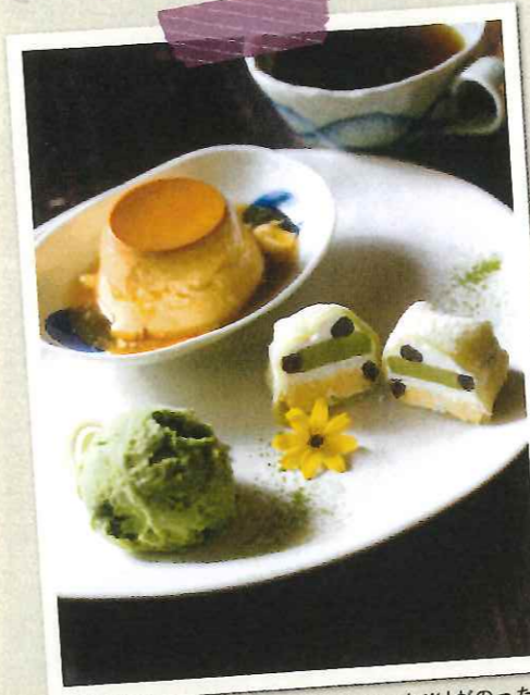
10サイズの大福スイーツ「もちもち※」がのった「もちプリンセット」900円 (※持ち帰り用もあり)