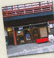
シーボルトの湯の近くに2013年10月にオープン。ぜひ立ち寄って

嬉野といえばお茶。豊かな降雨量と水はけの良い丘陵地帯がお茶の栽培には適地だったことからさかんに。茶葉が丸く、旨みやコク、香りが強いのが特徴。近年では、まるで砂糖を入れたような甘い味わいのうれしの紅茶も人気!