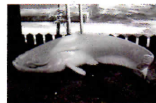
豊玉姫神社 なまぐ様